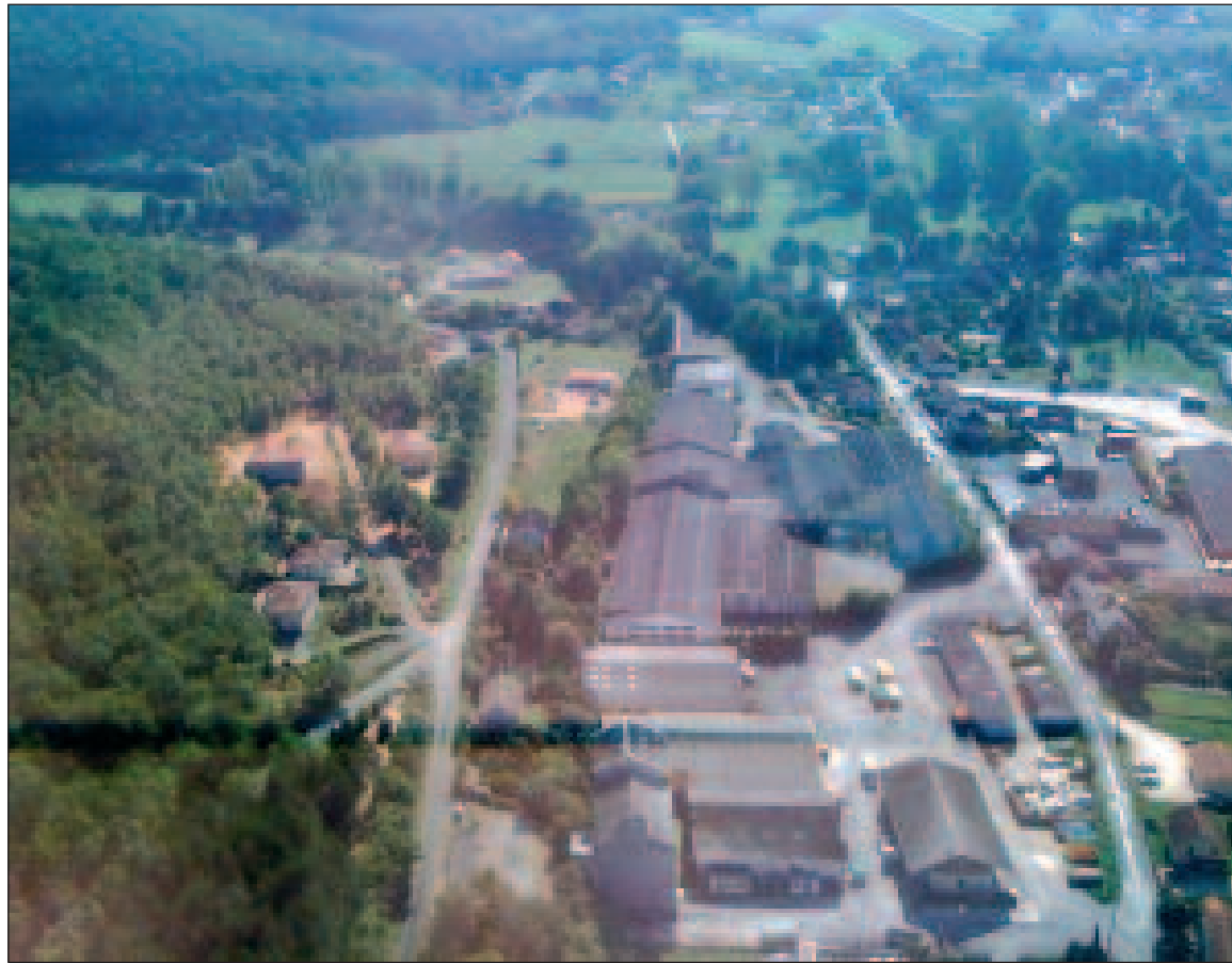
La friche industrielle Fima