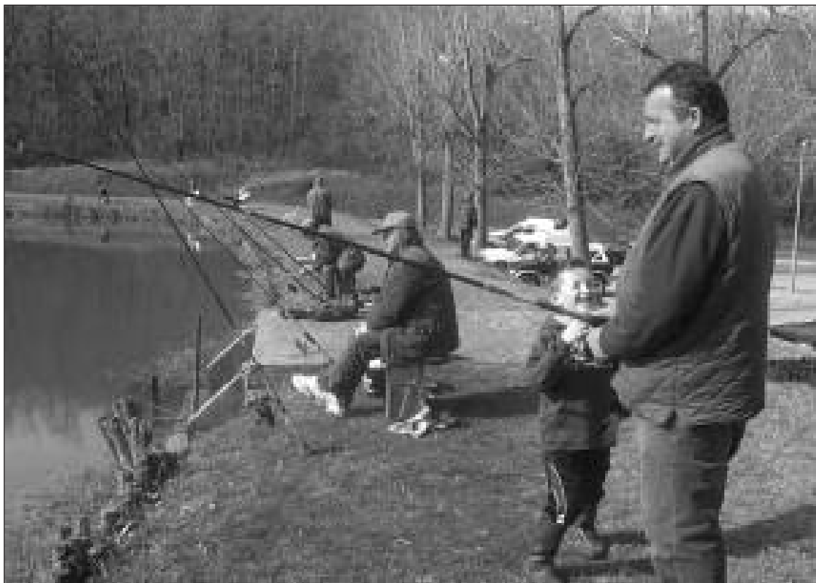
L'eau et la faune, des outils indispensables à notre survie