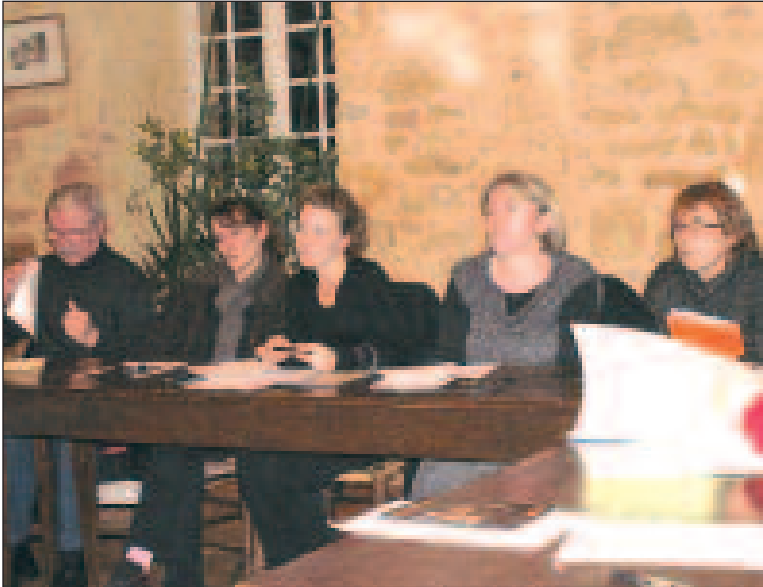
Parmi les représentants des associations