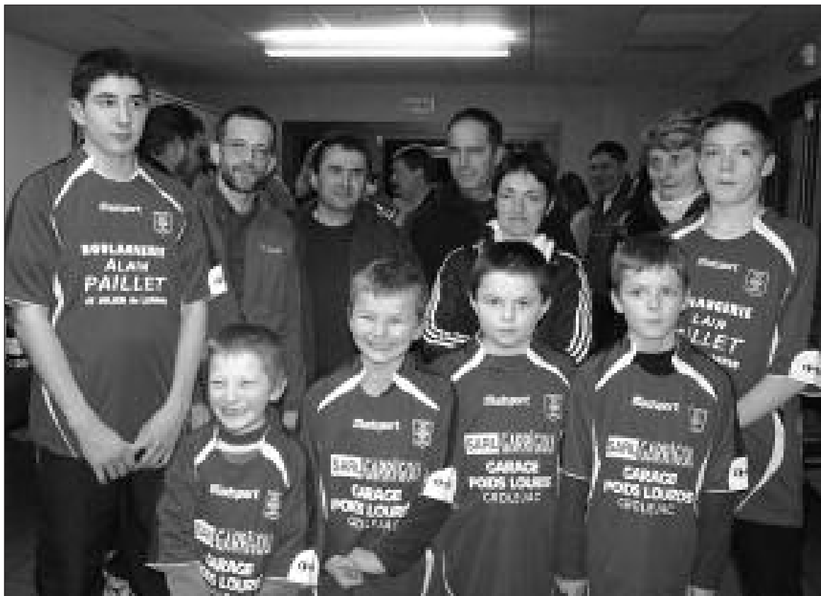
Lors de la remise des maillots

Samedi 30 janvier, seuls les U11 étaient en lice.