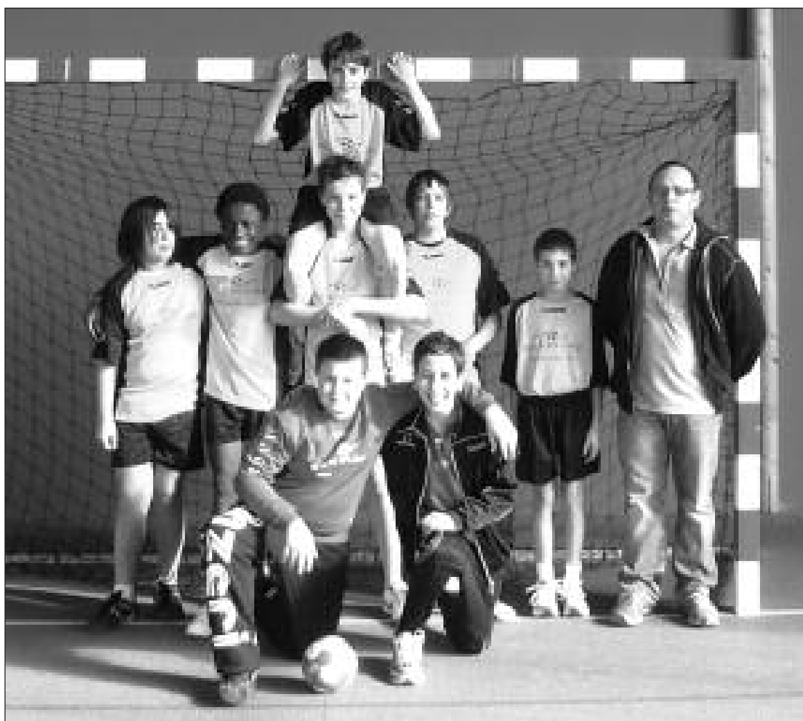
Les moins de 13 ans prêts pour le match

Les deux équipes de moins de 13 ans recevaient l'entente Champcevinel, CAP, Coulounieix-Chamiers au gymnase du Mascotlet pour le compte du championnat départemental : Salignac 1 bat CAP 1 (46 à 6) et Salignac 2 bat CAP (14 à 12).