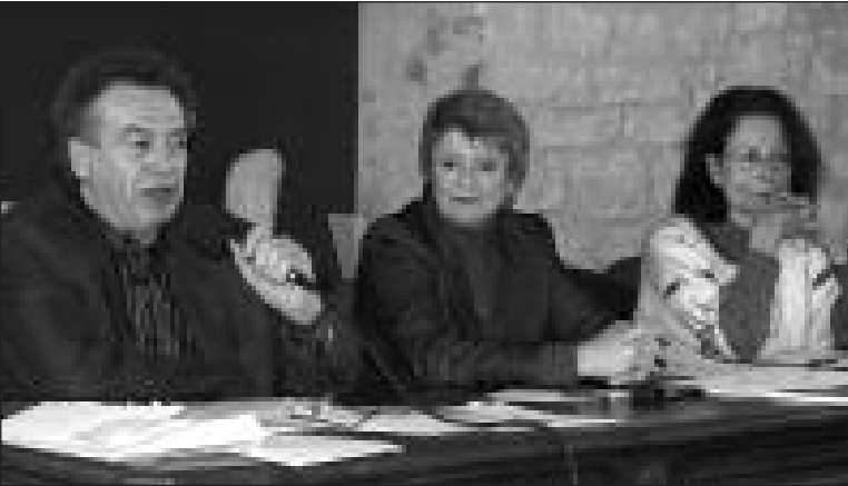
Le nouveau bureau